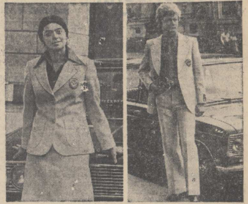
Так будет выглядеть парадная форма для советских олимпийцев. Ансамбль выполнен из льняной ткани светлого цвета. Рубашки хлопчатобумажные.