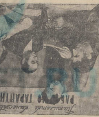
Уличное собрание Комитета райкома партии.

Совещание уличных комитетов подъездов состоялось в пятницу, 11 июня, в 10 часов утра в помещении Комитета райкома партии. На нем присутствовали представители всех уличных комитетов района. В повестку дня были включены вопросы: 1. О состоянии работы уличных комитетов. 2. О выполнении заданий райкома партии. 3. О мерах по улучшению работы уличных комитетов.