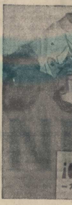
Уличное собрание Комитета райкома партии.

Награды лучшими уличными комитетами были вручены представителям лучших коллективов района. Награждение состоялось в пятницу, 11 июня, в 10 часов утра в помещении Комитета райкома партии. На нем присутствовали представители всех уличных комитетов района. В повестку дня были включены вопросы: 1. О состоянии работы уличных комитетов. 2. О выполнении заданий райкома партии. 3. О мерах по улучшению работы уличных комитетов.