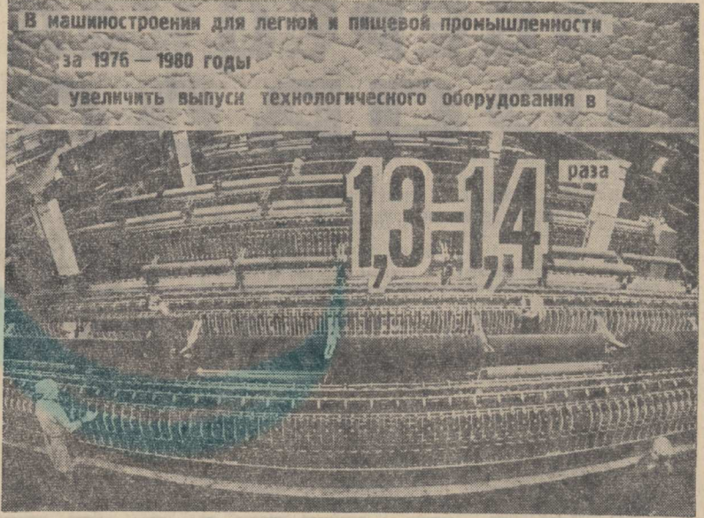
В машиностроении для легкой и пищевой промышленности за 1976 — 1980 годы увеличить выпуск технологического оборудования в

редактор машиностроительной газеты завода им. Ухтомского.