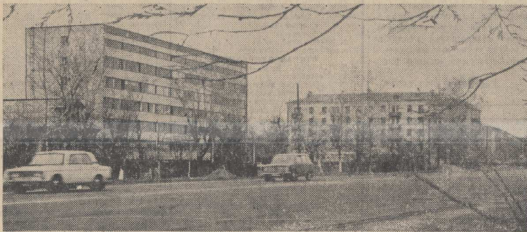
Новостройка на Октябрьском проспекте.