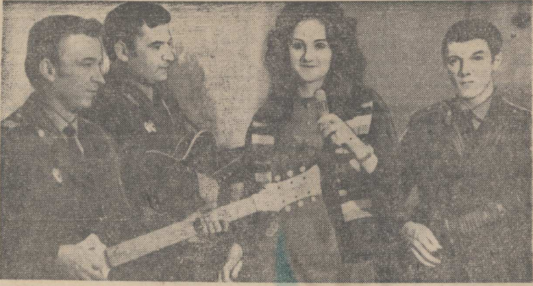
«Марш советской милиции», «За того парня», «Надежда» и другие советские песни исполняет этот ансамбль гитаристов на вечерах работников отдела внутренних дел Люберецкого горисполкома. Принимает он участие и в смотрах коллективов художественной са-