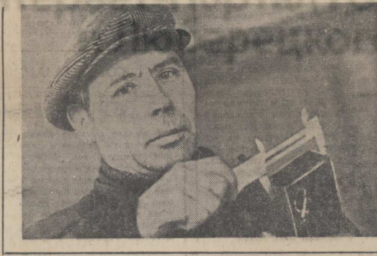
К 35-ЛЕТИЮ РАЗГРОМА ФАШИСТСКИХ ВОЙСК ПОД МОСКВОЙ

В ОКТЯБРЕ грозного сорок первого года, когда, несмотря на героическое сопротивление Красной Армии, немецко-фашистские полчища остервенело рвались к сердцу нашей Родины — Москве, в ряды ее славных защитников вставали сотни и тысячи патриотов столицы — коммунистов, комсомольцев, беспартийных. В эти же дни родилась и 2-я Московская дивизия.