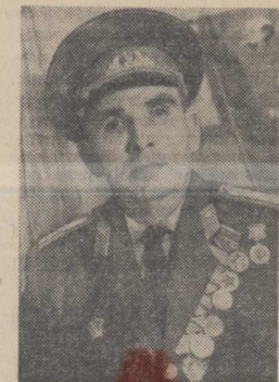
ками милиции, передовиками службы.