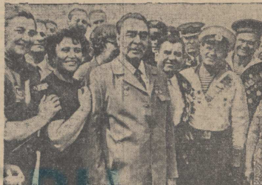
Сентябрь 1974 года. Пребывание Генерального секретаря ЦК КПСС Л. И. Брежнева в городе-герое Новороссийске.

Так называется новый цветной документальный фильм, созданный Центральной студией документальных фильмов. Он повествует о жизненном пути Генерального секретаря ЦК КПСС Л. И. Брежнева. Фильм выходит на экраны кинотеатров нашего района.