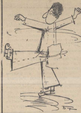
Рис. Д. Бараб-Тарле.