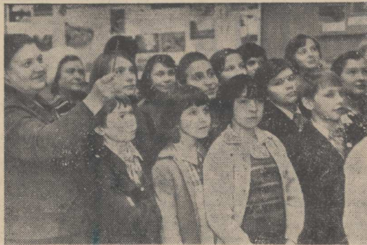
Большую работу с детьми проводит Люберецкий Дом пионеров. Недавно здесь была организована выставка юных туристов и краеведов района. Активное участие в ней приняли ребята из школ №№ 6, 24, 32, 46, 55. Их стенды рассказывали о поисках, походах по местам революционной, боевой и трудовой славы советского народа.

● ГРУППА работников управления гражданской авиации Центральных районов недавно совершила увлекательную поездку в один из древнейших городов нашей страны — Ереван. Люберечане осмотрели памятники культуры, побывали в музеях и театрах столицы Армянской ССР.