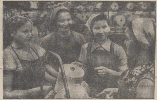
Московская область. Дедовская прядильно-ткацкая фабрика названа в числе лучших предприятий страны в Письме ЦК КПСС, Совета Министров СССР, ВЦСПС и ЦК ВЛКСМ.