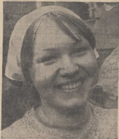
А дома ее ждут двое малышей. Сейчас они уже подросли, но сколько с этими крохами было трудностей!