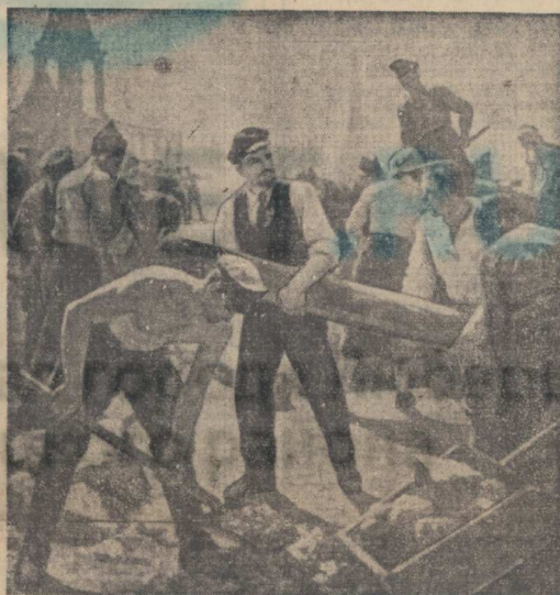
В. И. ЛЕНИН НА КОММУНИСТИЧЕСКОМ СУББОТНИКЕ. (Издательство «Плакат»).

Все на ленинский коммунистический субботник!