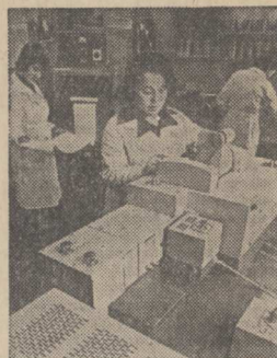
Ленинград. Научно-производственное объединение «Пластполимер» — головное предприятие страны по созданию и развитию промышленности полимеризационных пластмасс, которые используются в самых различных отраслях народного хозяйства.

175 докторов и кандидатов наук трудятся в объединении. Они возглавляют работу по созданию новых видов пластических масс, технологий их изготовления, решению задачи повышения качества и долговечности пластиков.