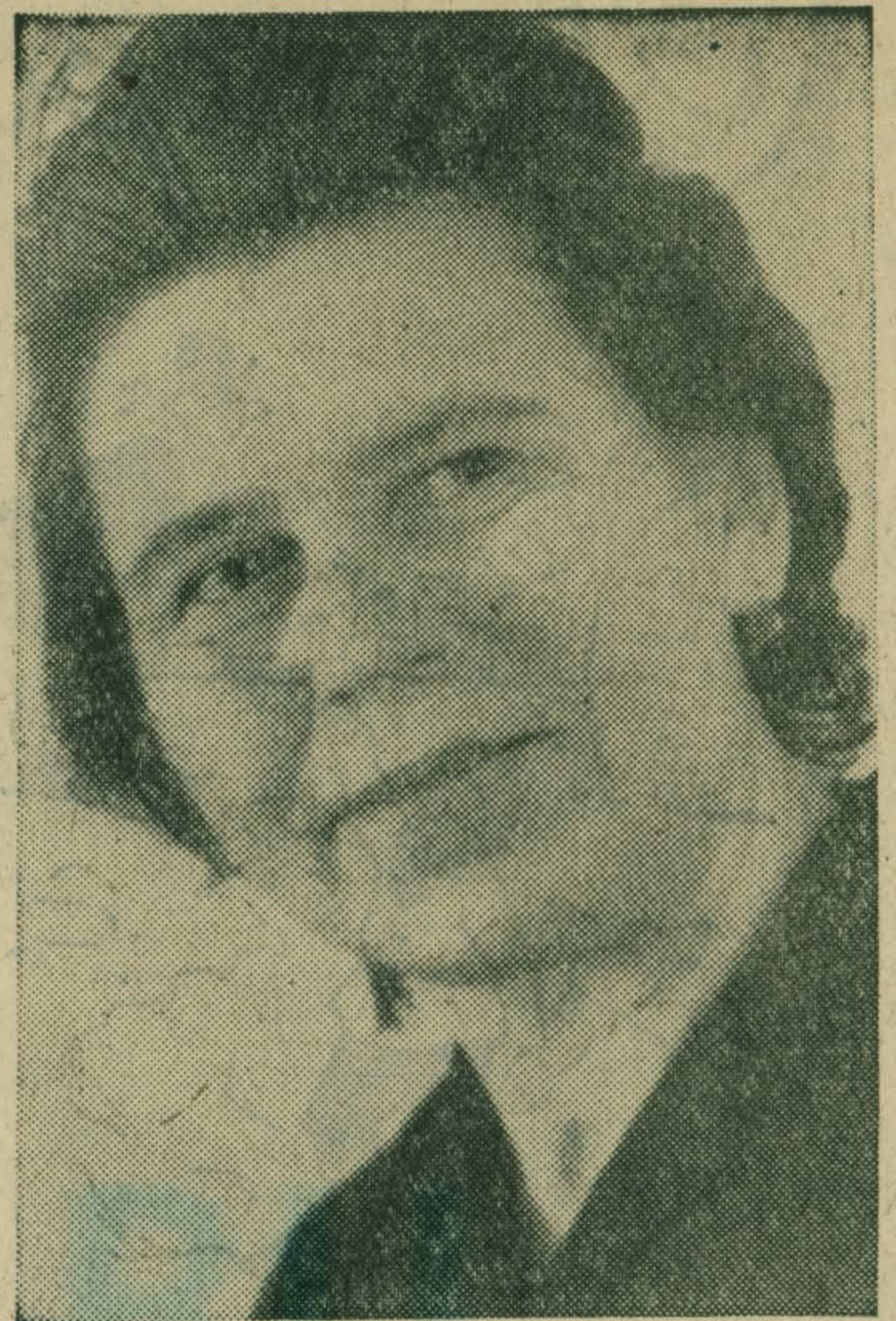
На снимке П. А. Савкина.