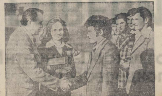
Короткой традицией стало в Тернопольском профессионально-техническом училище № 21 Украинской ССР торжественно проводить в ряды Советской Армии учащихся, которым подошел срок службы.