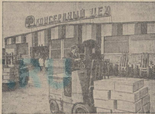
Ростовская область. «Красный сад» Азовского района — крупное агропромышленное предприятие. Его сады занимают более двух тысяч гектаров. Хозяйство ежегодно собирает около 15 тысяч тонн фруктов и ягод. 45 процентов урожая перерабатывается консервным цехом. В прошлом году изготовлено 16,5 миллиона банок соков, компотов, варенья, джемов.

НА СНИМКЕ: паром в Холмском порту.