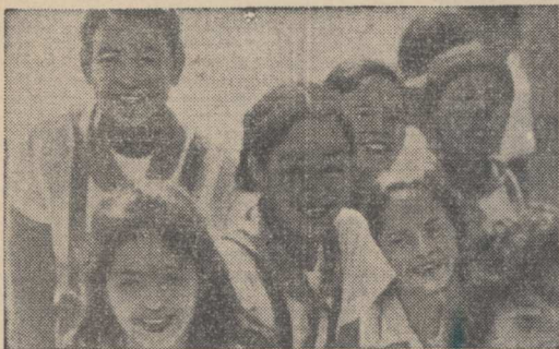
Столица XI Всемирного фестиваля молодежи и студентов Гавана готовится принять посланцев юности планеты.

По-праздничному украшаются площади и улицы города. Повсюду транспаранты, плакаты, эмблемы фестиваля. Все напоминает о приближении молодежного форума.