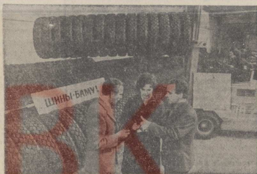
Киевская область. Две тысячи грузовых автомобилей для БАМа «обули» выпущенной сверх плана с начала года продукцией с государственными Знаком качества производственными Белоцерковским шинного завода.

В результате четкого взаимодействия всех производственных звеньев коллектив предприятия добился надежной, безаварийной работы агрегатов, ускоренного ритма сборки автопокрышек.