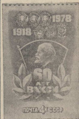
Москва. Министерство связи СССР выпустило почтовую марку, посвященную 60-летию ВЛКСМ (на снимке).