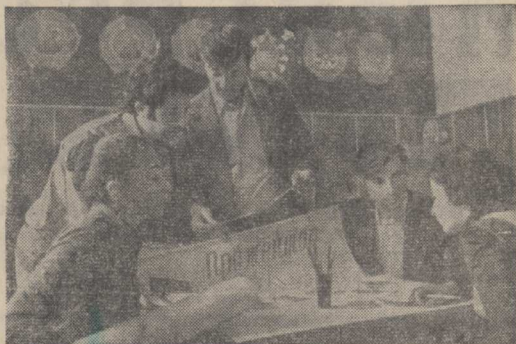
Каждый второй труженник Тбилисского завода управляющих вычислительных машин научно-производственного объединения «Эва» — комсомолец.

Руками молодых специалистов рождается сложнейшая современная техника — вычислительные комплексы, управляющие тепловыми и атомными электростанциями, контролируемые научные эксперименты, помогающие руководить целыми предприятиями и отраслями.