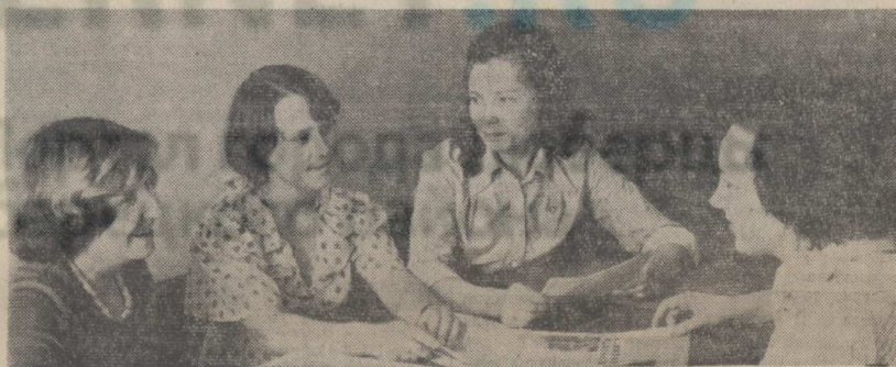
Вопросы социалистического соревнования находятся в центре внимания комсомольской организации объединения «Спецдежда».