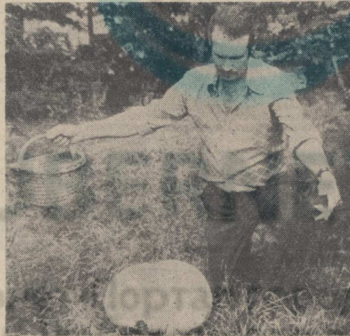
Мала корзинка грибника Для этого дождевика!