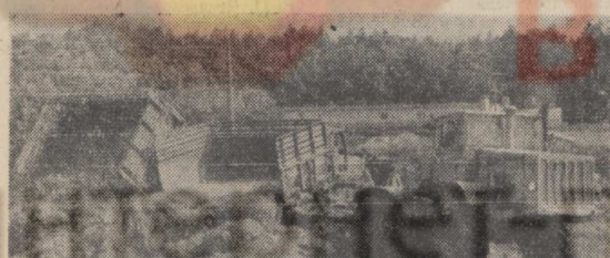
Племсовхоз «Малышево» социалистическое обязательство по заготовке сенажа перевыполнил, но закладка сенажной массы в траншеи продолжается.

Руководителям хозяйств, партийным организациям следует принять исчерпывающие меры для быстрого завершения важной сельскохозяйственной кампании.