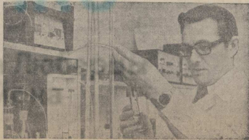
МОСКВА. Рассмотреть и понять механизм работы мышцы на молекулярном уровне впервые удалось советским ученым.

Как сообщил вице-президент Академии наук СССР Юрий Анатольевич Овчинников, эта работа осуществлена благодаря использованию синхрофазотрона. Ученые проследили за всеми изменениями, которые происходят в клеточных структурах мышцы во время ее работы. Исследования проводились на изолированных тканях.