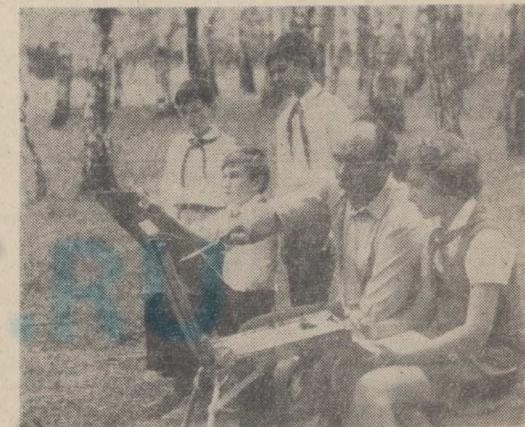
Отзвенело радостное пионерское лето, но еще долго память о нем будет сохраняться у ребят. Вспомнит они и о том, что юные художники пионерского лагеря создали им. Ухтомского выбрали своей творческой мастерской березовую рощу.

— Слушай, Гонсалес, у нас есть одно вакантное место, и его мог бы занять твой брат-близнец... — Брат-близнец? — Да... Тот, кого я видел вчера на футбольном матче, когда ты был на похоронах своего дяди.