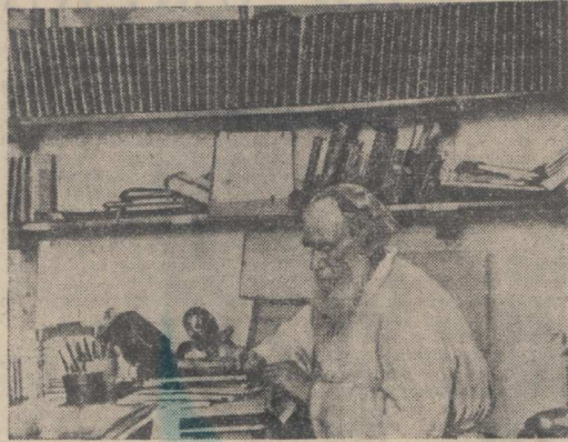
Л. Н. Толстой за работой в Ясной Поляне. 1908 год.