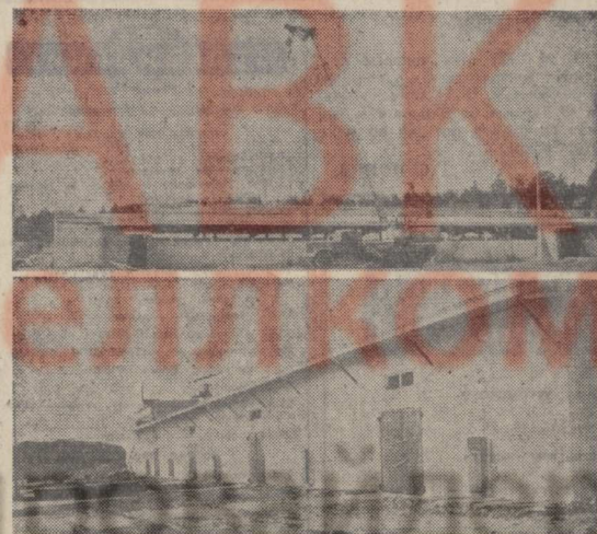
НА СНИМКАХ: общий вид строящегося телятника (фото сверху); на нижнем снимке — так выглядит картофелехранилище.

Полным ходом идет строительство телятника на 500 голов. По плану коллектив СМУ-5 должен выполнить объем работ в этом году на 100 тысяч рублей. Освоено больше. Строители прилагают усилия, чтобы в четвертом квартале ввести в эксплуатацию помещение для молодняка. «Коробка» уже смонтирована, ведется бетонирование полов. К сожалению, управлению производственно-технологической комплектации треста «Обособстрой» № 2 не сумело обеспечить регулярные поставки бетона на стройплощадку. А. КИРИЛЛОВ.