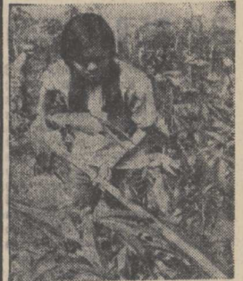
В Социалистической Республике Вьетнам расширяет географию своего «расселения» касса — ценная сельскохозяйственная культура, из клубней которой получают крахмал, спирт, глюкозу, ацетон и другие ценные вещества. В новых экономических районах республики под нее расчищены обширные участки земли. НА СНИМКЕ: обработка кассавы.