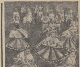
ВОЛЫНСКАЯ область. Более четверти века несет радость людям самостоятельный ансамбль песни и танца «Колос» Торчинского сельского Дома культуры Луцкого района. Ему присвоено звание заслуженного ансамбля песни и танца.

Счастливого пути вам, юные музыканты, творческих вам успехов! Г. ВИКИН.