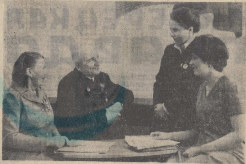
Имя Великого Октября живет в названии фабрики им. Октябрьской революции, в названии поселка — Октябрьский. Сюда в 1921 году к рабочим-текстильщикам приезжал В. И. Ленин.