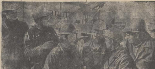
В Калевальском районе Карелии совместно с фирмами Финляндии ведется строительство Костомушского горно-обогатительного комбината и города Костомукша.

Советские и финские строители возводят основные объекты с опережением намеченных сроков.