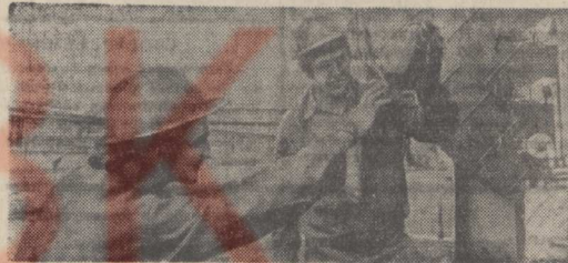
ЧССР. Нефтехимический комбинат «Словнафт» в Братиславе, построенный при техническом содействии Советского Союза, ежегодно перерабатывает более 9 миллионов тонн советской нефти, поступающей прямо на предприятие по нефтепроводу «Дружба».

Сейчас «Словнафт» выпускает свыше 140 видов химической продукции, значительная часть которой экспортируется в страны — члены Совета Экономической Взаимопомощи.