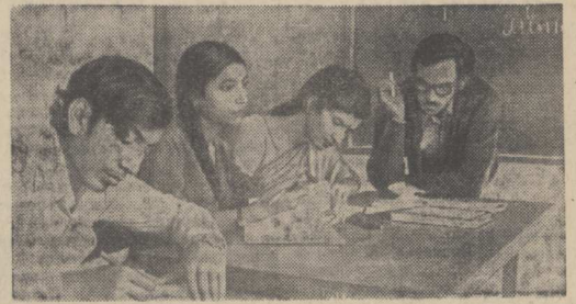
Большой популярностью среди индийской молодежи пользуется русский язык. Его изучают в 50 университетах и высших учебных заведениях страны. Выпускники факультетов русского языка работают в государственных учреждениях, на стройках, ведущихся в Индии с помощью Советского Союза.

Е. БЛИНОВА, инженер по соревнованию Томлинского завода алмазных инструментов.