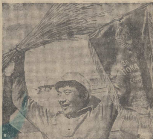
1978 г. Есть миллиард пудов казахстанского хлеба!

Книга воспоминаний Л. И. Брежнева «Целина» выпущена отдельным изданием Издательством политической литературы.