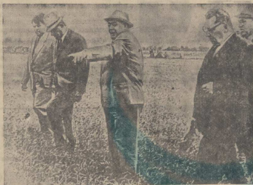
Л. И. Брежнев в целинном совхозе.

Великому подвигу советского народа посвящено произведение Леонида Ильича Брежнева «Целина». О подвиге сотен тысяч коммунистов, патриотов-целинников, об их настойчивости, смелости, трудовой инициативе повествует автор воспоминаний «Целина».