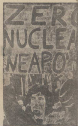
«Нет — ядерному оружию!» — сегодня это требование миллионов борцов за мир во всех концах земного шара.

На снимке: во время демонстрации жителей американского штата Нью-Йорк.