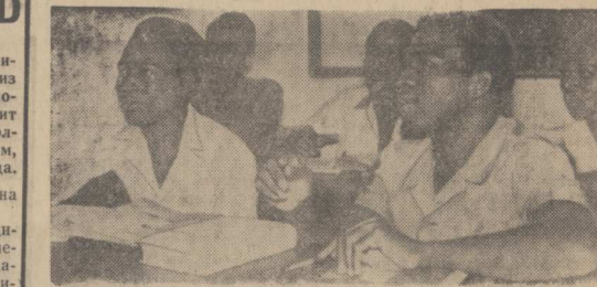
В советском культурном центре в Угадугу — столице Верхней Волды работают курсы русского языка. Более 150 юношей и девушек — школьников, студентов, служащих и рабочих — не только изучают язык страны Великого Ленина, но и знакомятся с историей и развитием СССР, произведениями классиков русской и советской литературы.