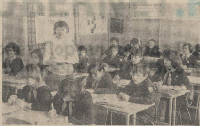
Ребята с большим вниманием слушают свою учительницу.

Закончились весенние каникулы школьников. Началась последняя, четвертая четверть. Впереди напряженная работа. Урок математики в 5-м классе люберецкой школы № 1 ведет Екатерина Григорьева и Мамонтова.