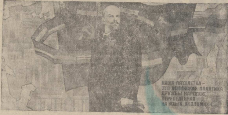
НАША ПЯТИЛЕТКА — ЭТО ДЕННИКА ПОЛИТИКА БУДУЩЕГО НА ЯЗЫК ЭКОНОМИКИ