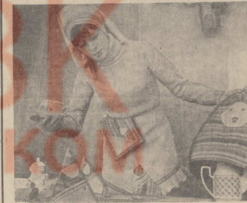
Такой чайный комплект, состоящий из скатерти, салфеток, грелки, передника и косынки, изготавливают в ателье шейного объединения «Рассвет» города Витебска.