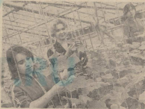
Училище, расположенное на территории совхоза «Марфино», имеет свою учебно-производственную базу. Здесь учащиеся получают навыки работы в теплицах.

АДРЕС УЧИЛИЩА: 127427. Москва, Нашеннин луг, дом № 4, телефоны 218-16-77, 218-40-95.