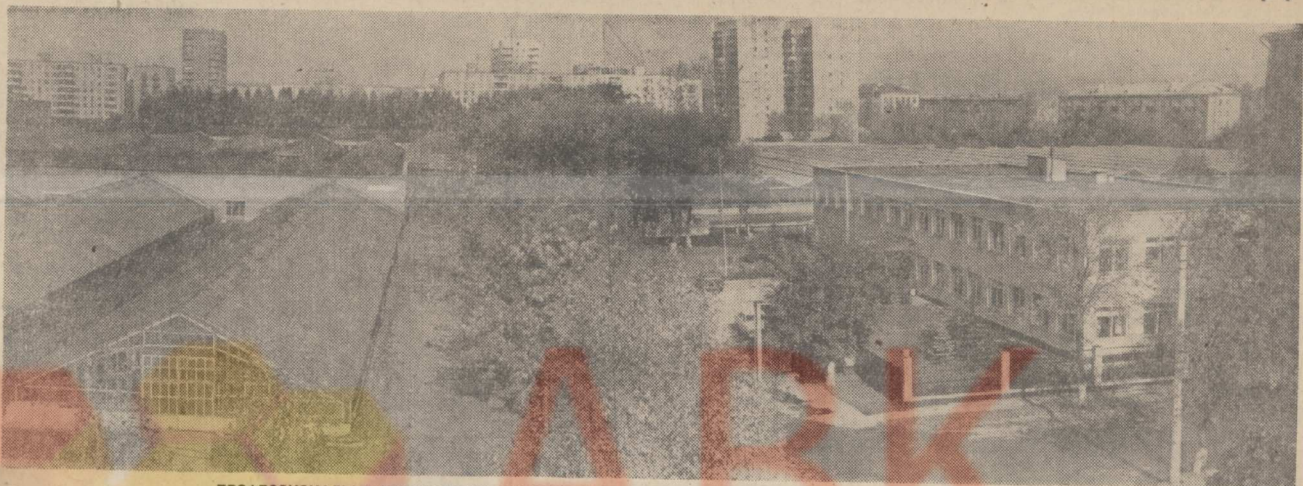
ПРОФЕССИОНАЛЬНО-ТЕХНИЧЕСКОЕ УЧИЛИЩЕ № 165 НА ПЕРЕДНЕМ ПЛАНЕ (СПРАВА) — УЧЕБНЫЙ КОРПУС.