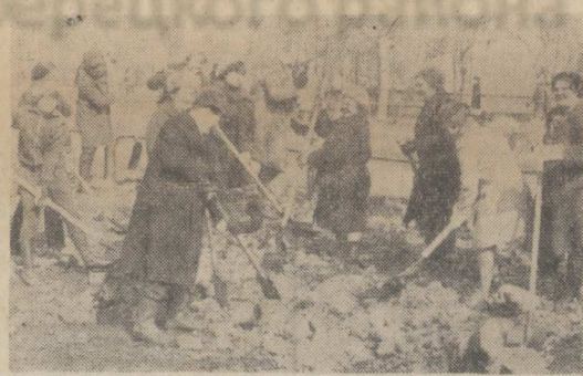
Завод торгового машиностроения расположен на Октябрьском проспекте, и его коллектив проявляет заботу о благоустройстве своего микрорайона.

НА СНИМКЕ: в один из субботних дней работники завода убили территорию, закрепленную за предприятием. Работали люди энергично, весело.