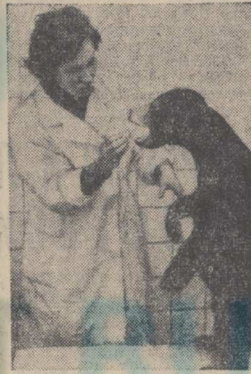
Осенью прошлого года в Москву прибыл необычный «груз» из Лаоса — малайский медвежонок. Маленький пассажир хорошо перенес воздушное путешествие и поселился в Московском зоопарке.

Сегодня «Юность» намечает принять первую партию детей — около 380. А. БЕЛОВ.