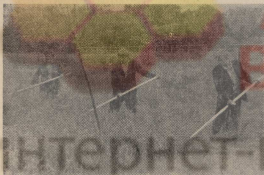
Дойное стадо госплемзавода «Петровское» насчитывает 700 коров. Здесь же выращиваются телки и племенные бычки. А сенокосных удобий хозяйство не имеет. Часть грубых кормов для головного предприятия заготавливает племсовхоз «Ульянино». Недостающее же количество добывается на лесных полянах, по берегам Москвы-реки, вдоль дорог.