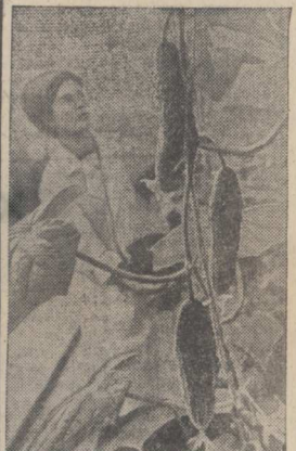
ЧИТА. Первенец тепличного производства овощей в Забайкалье — совхоз «Черновский», использует дешёвое тепло Читинской ГРЭС. В четвертом году пятилетки здесь будет выращено 1350 тонн огурцов, томатов, лука.

Средняя урожайность по хозяйству составляет более 36 килограммов овощей с одного квадратного метра.