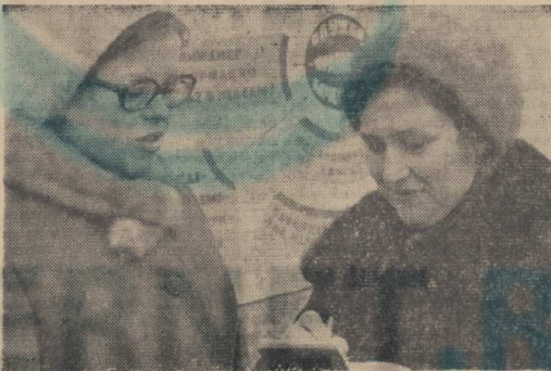
Народные контролеры Коренецкого завода стройматериалов и конструкций провели очередной рейд. Меры, принятые по результатам деятельности народных контролеров, осязательно отразились на повышении производительности труда.

На заседании ГК НК рассматривался вопрос о результатах проверки по выявлению резервов увеличения перевозки народнохозяйственных грузов, сокращения простаивающих вагонов на станциях и предприятиях района.