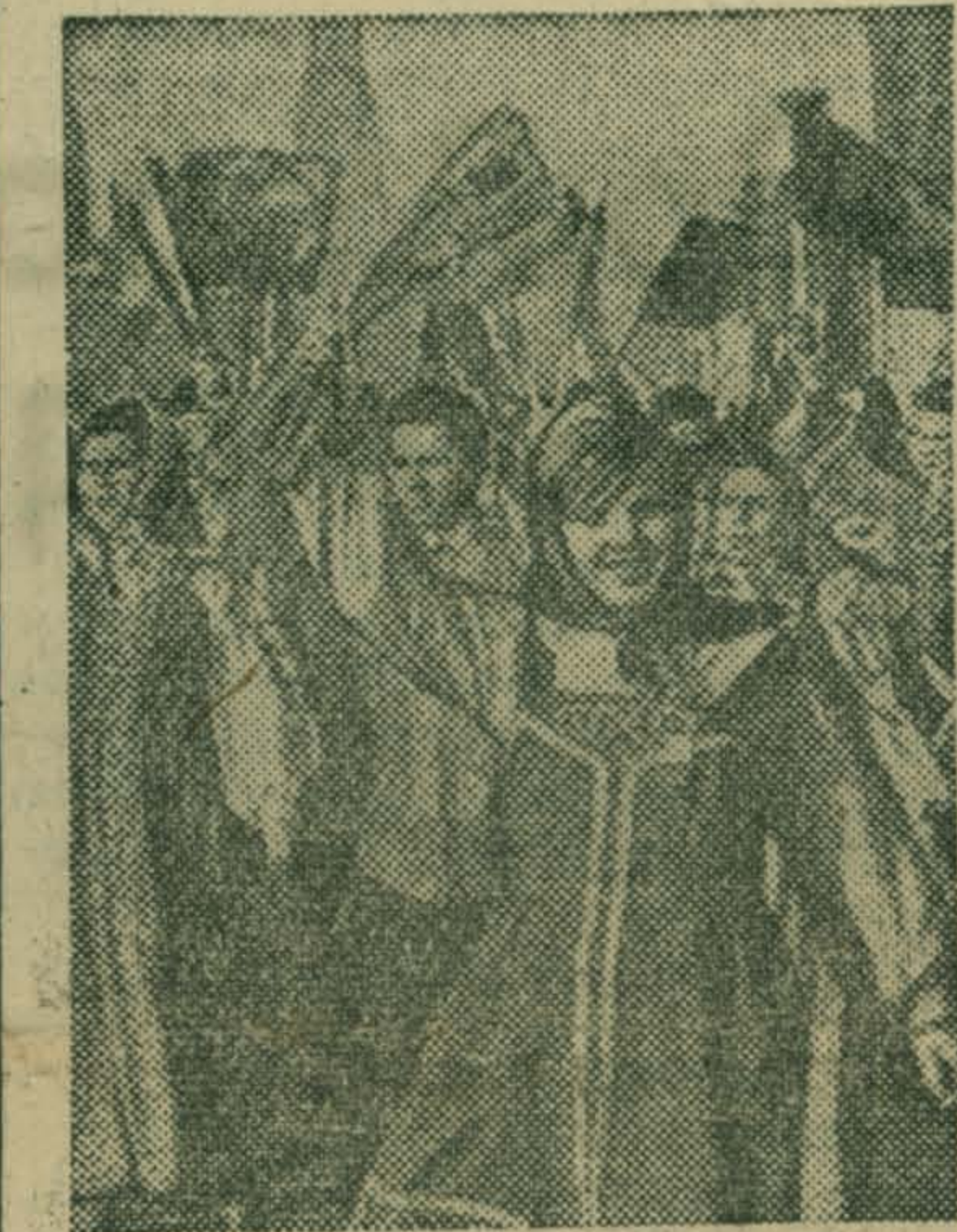
Демонстрация представителей трудящихся на Красной площади.

Радостно отметили люберчане всенародный праздник. С хорошим настроением, с новыми силами начали они первый трудовой день 51-го года Великого Октября.