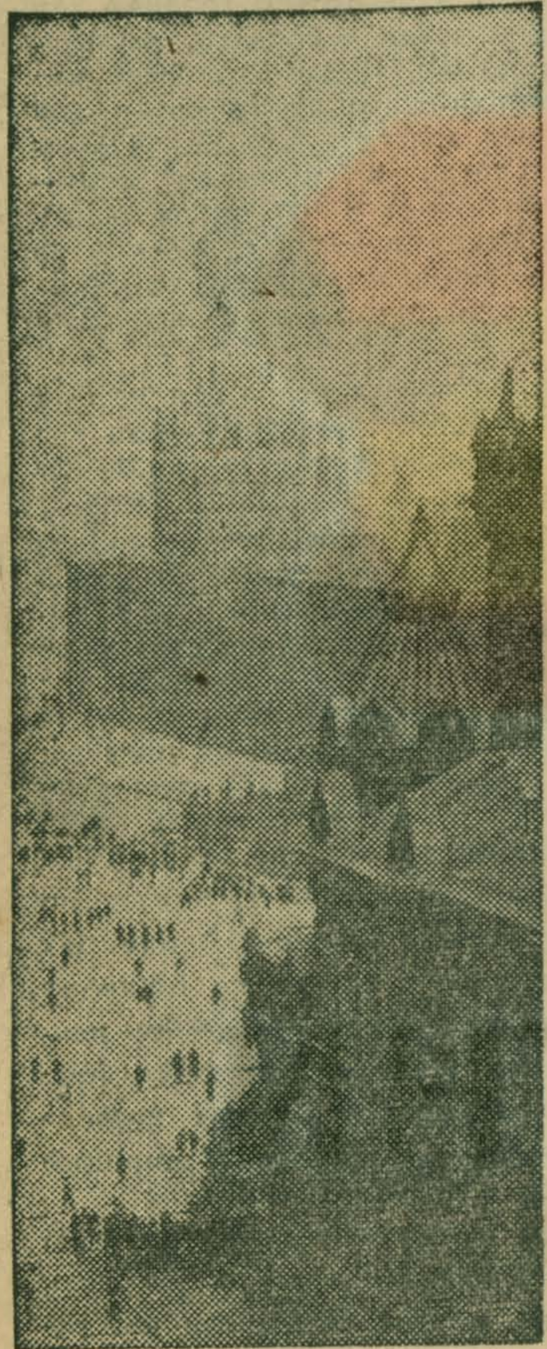
Москва. Вид на Красную площадь.

У кореневцев одно стремление — досрочно завершить план юбилейного, 1967 года и задания пятилетки.