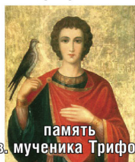
память Св. мученика Трифона