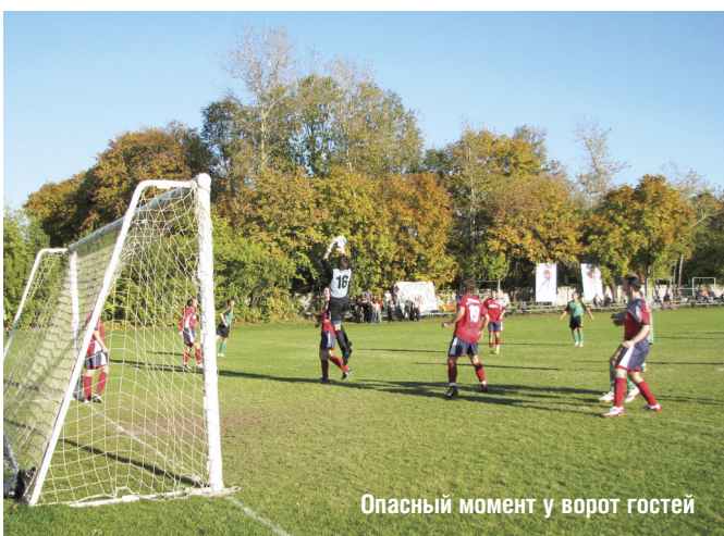
Опасный момент у ворот гостей

До конца Первенства России по футболу для команд III-го дивизиона Московской области (группа «Б») осталось сыграть 5 матчей. В субботу 9 октября ФК «Торпедо» (Люберцы) встретились с ФК «Балашиха» (Балашиха). Матч прошел в Томилино на стадионе «Урожай» (мкр. Птицефабрика) и завершился со счетом 0:0