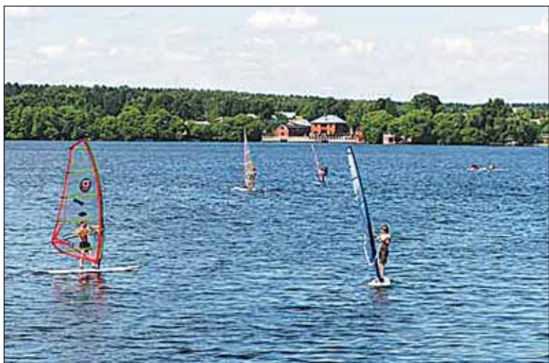
На Клязьминском водохранилище

«Российская газета» - Неделя № 5534 (158)