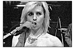
Окончание на стр. 20