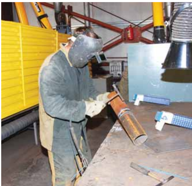
Победители и призеры состоявшегося конкурса отмечены дипломами и денежными премиями в «Крокус Экспо» на выставке «Строительная неделя».

В канун Дня строителя в Дзержинском состоялся областной конкурс сварщиков