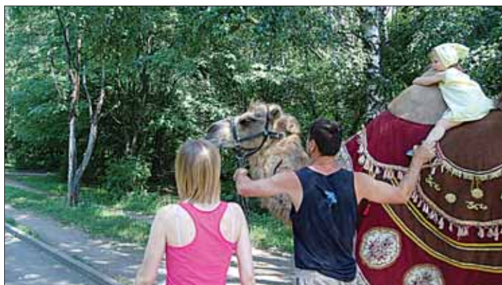
Верблюд: «Хоть я и спокоен, но страховка не помешает!»