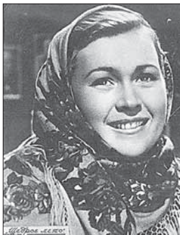
Нина Архипова в фильме «Щедрое лето»

– Голос человека – показатель его возраста. У Нины голос остался таким же звонким юношеским, и с возрастом он абсолютно не меняется, – подчеркнула народная артистка России, художественный руководитель Российского государственного академического камерного «Вивальди-оркестра»