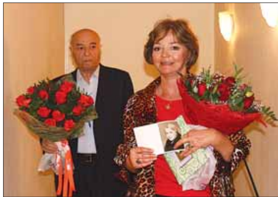
Народный артист СССР Владимир Этуш с дочерью Рансой