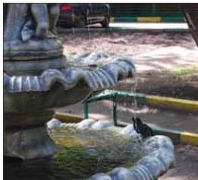
Скворец: «Уф, угорел... Холодненькая пошла!»