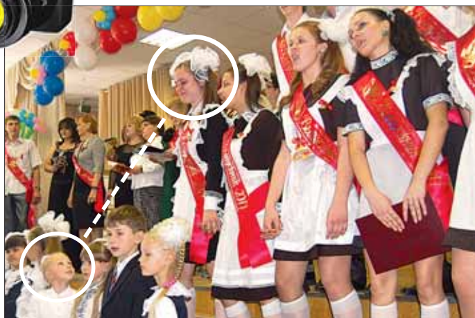
Кто кому завидует?