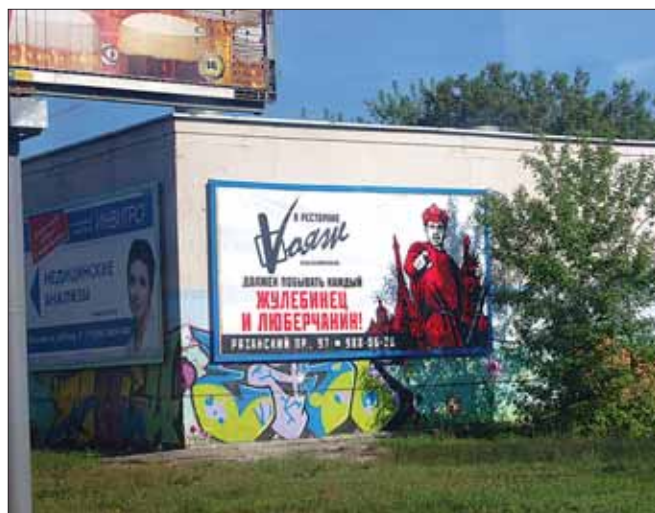
Должны? Будем. (Плакат на Рязанском проспекте, рядом с метро «Выхино»)