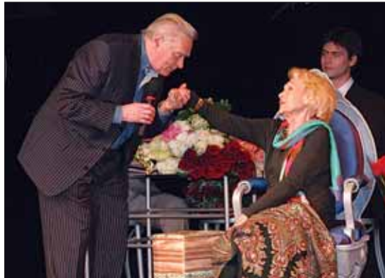
Поздравляет народный артист СССР Владимир Андреев