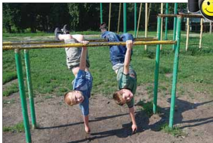
Кто над нами вверх ногами?