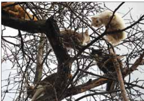
Главный кот: «Обязуемся дать мартовский концерт в феврале!»