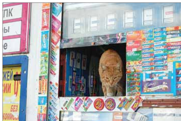
Кот-киоскер: «У меня - перерыв. Ну, кто мне спать не дает?»