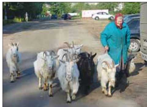
Семеро «козлят»: «Интересно, кем мы были в прошлой жизни?»