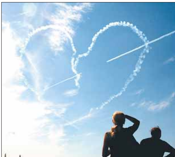
Сердце для любимой