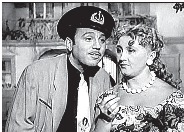
Фильм-спектакль «Белая акация», 1957 г.

дась здесь во время оккупации в годы войны.