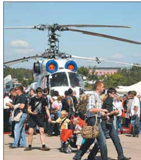
Самая популярная экспозиция вертолетов - из Люберец