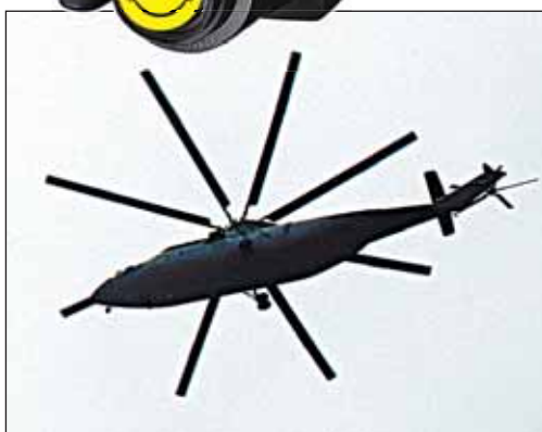
Люберецкая гордость - МИ 26