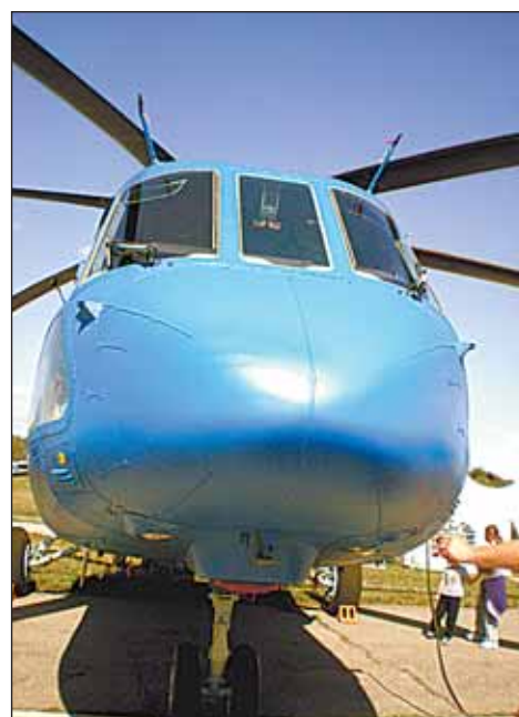
МИ-38 - вертолёт для волшебника