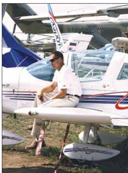
Тоска по небесам