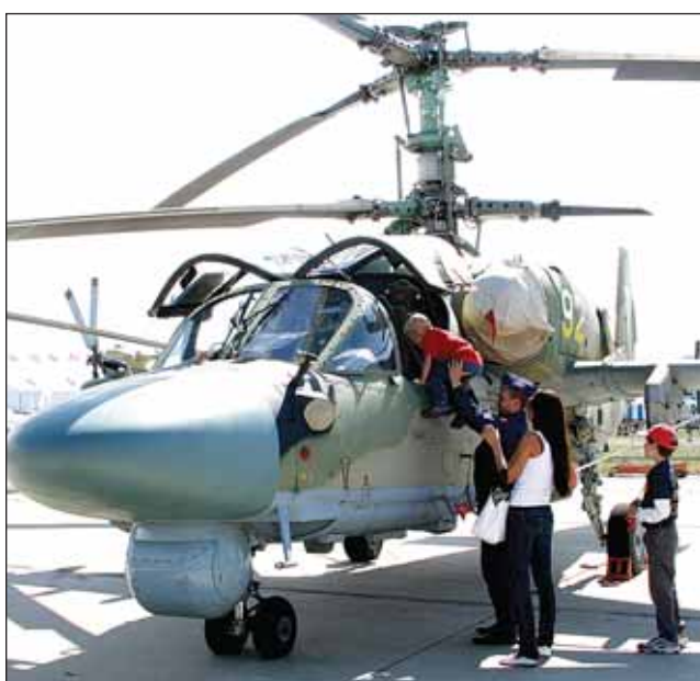
«Черная Акула» пользуется необыкновенным успехом у мальчишек