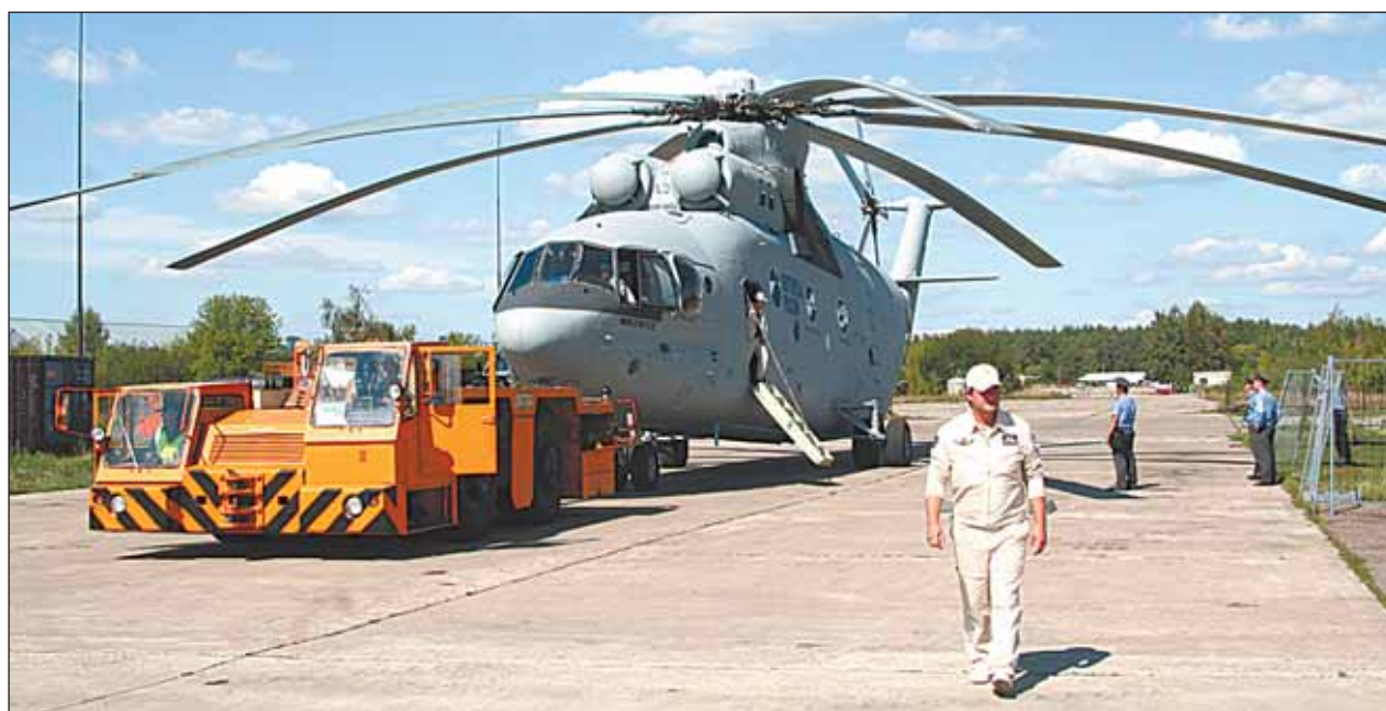
МИ-26. Пора в полёт