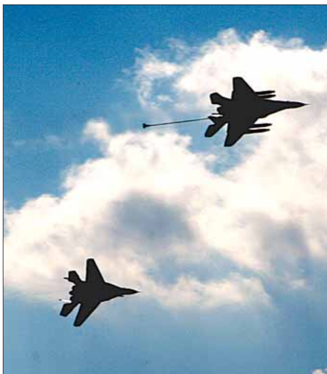
Подготовка к дозаправке в воздухе