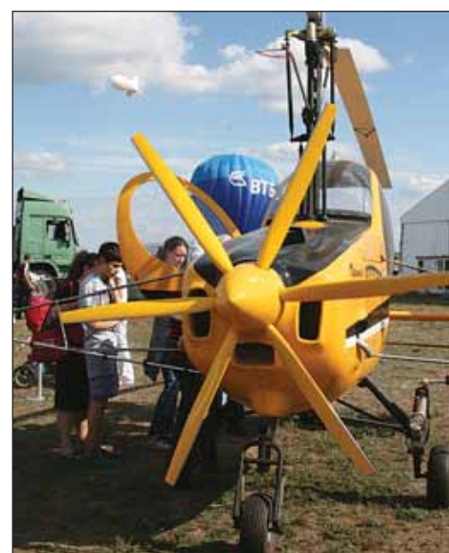
Автожир. Идеи Камова и Скржинского не умирают