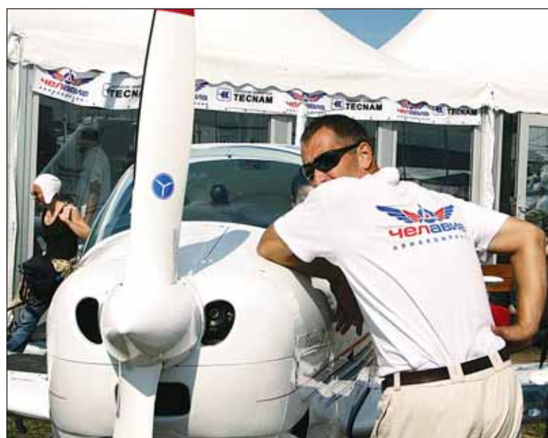
Аэротакси к вашим услугам!