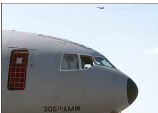
Большой и маленький