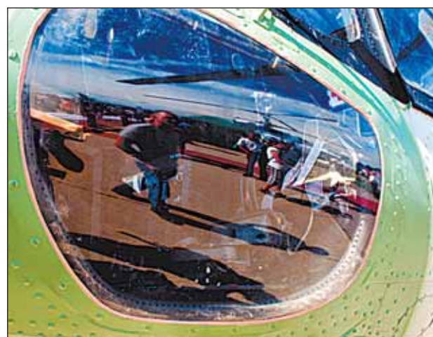
Мир «глазами» вертолёт МИ-2