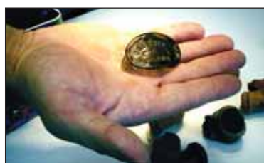
Клеймо от старинного флакона

- Правильно. А ведь в восемнадцатом столетии, скажем, никаких мусоропроводов не было. Просто копали на заднем дворе большую яму, обкладывали стену деревянным срубом – и весь бытовой