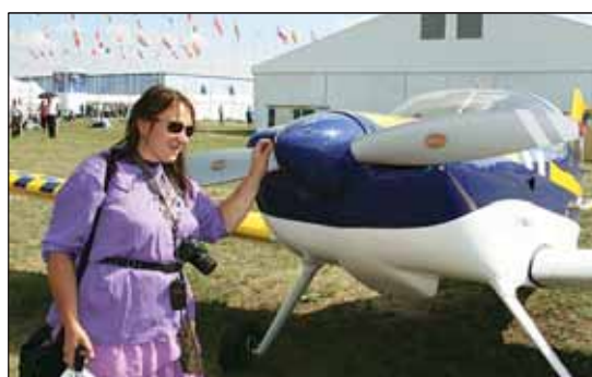
Скажите, а он настоящий?