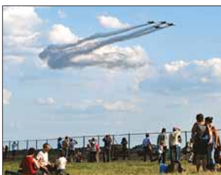
Зрители и самолеты