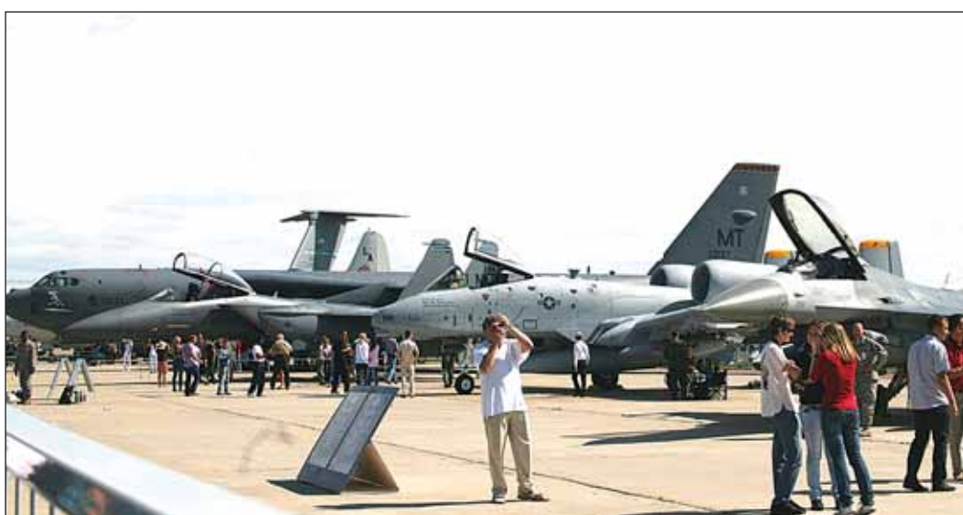
Своим ходом из Америки