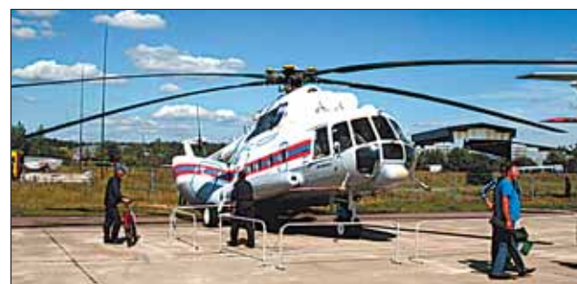
МИ-8 - скромный труженик МЧС