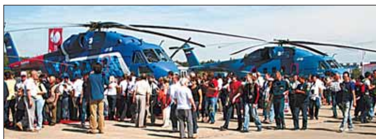
МИ-38 - новейшая разработка концерна «Русские вертолёт»