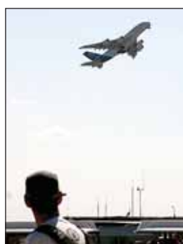
Летает французский аэробус