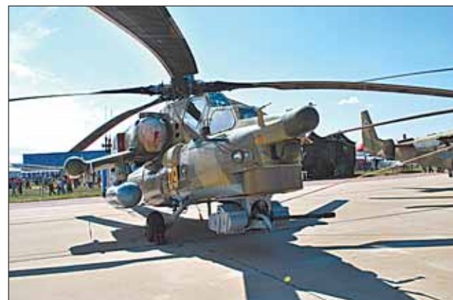
МИ-24 - ветеран Афганистана