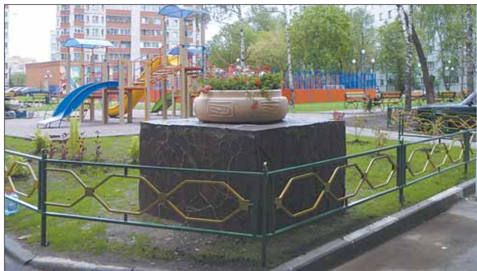
Двор на ул. Шоссейная, 6 удостоен Диплома I степени министерства ЖКХ Московской области