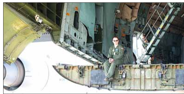
Дождь. Американскому летчику скучно