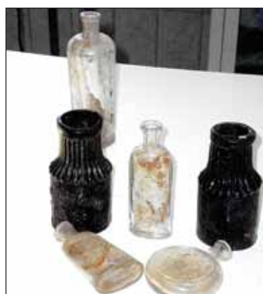
Сосуды 19-го века

- Вот, скажем, бутылка из-под обыкновенной минералки. Сделана в девятнадцатом веке, примерно в восьмидесятых годах... Видите на клейме двуглаво-