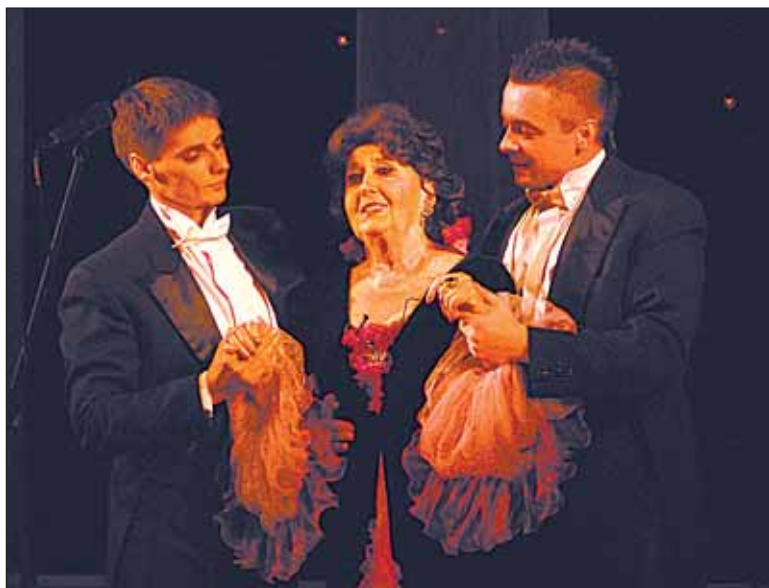
Спектакль «Бал в честь короля», 2010 г.

Богдан КОЛЕСНИКОВ Фото автора и из архива