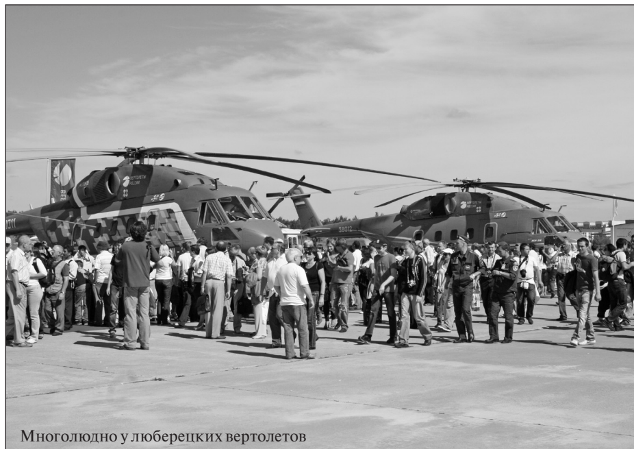
Многолюдно у люберецких вертолетов