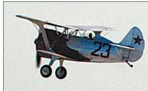
И-15 (1939 г.)

МАКСа презентация этих машин рассчитана на заключение контрактов для дальнейшего производства. Посмотрим, кому в этом мире понадобится винтокрылая стрекоза, способная взлететь на высоту, равную самой большой горе мира – Эвересту: на испытаниях эти вертолеты запросто поднялись над землей на восемь тысяч метров. Автор концепции – концерн «Вертолеты России».