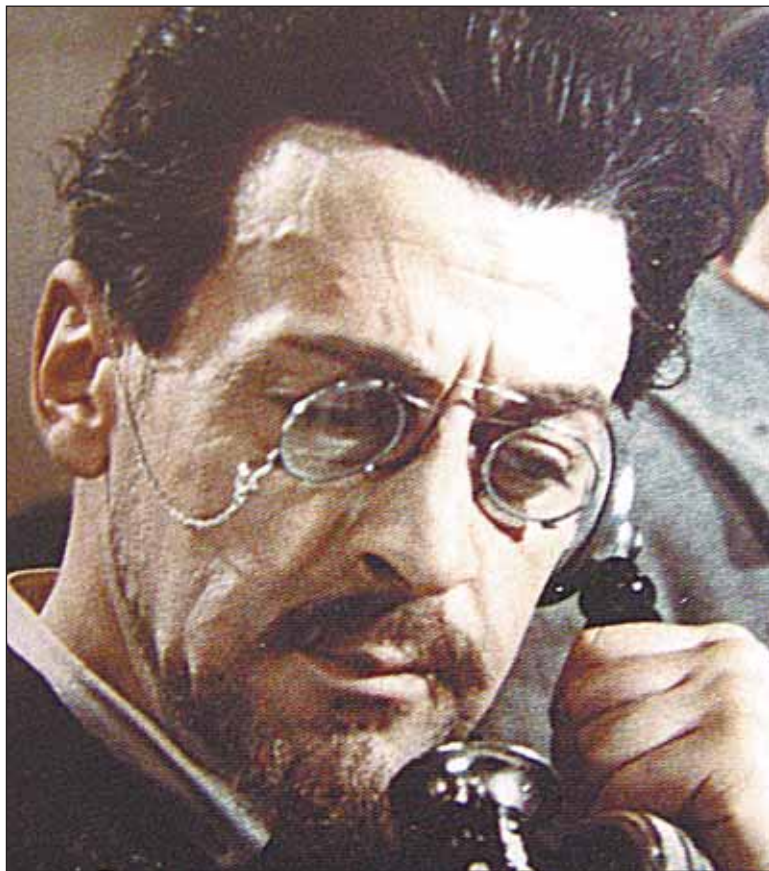
«Залп «Авроры». 1966 г.

Богдан КОЛЕСНИКОВ Фото автора и из архива