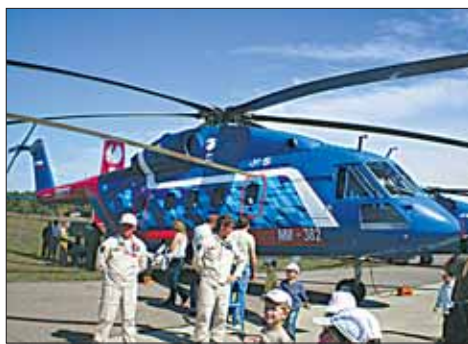
Ми-38 - новейший люберецкий вертолёт