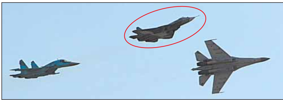
Т-50: всё-таки он летает!

Да, собственно, вот и они: пара ярко-голубых «Ми-38» многоцелевого назначения. Хочешь – пожары с ними туши, хочешь – Президента доставляй на переговоры в любую из европейских держав. Переоборудование потребует минимальное! Таких вертолетов во всем мире пока только три – два в Люберцах и один на филиале МВЗ в Казани. Впрочем, в деловой программе