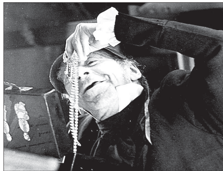
«Гобсек». 1987 г.