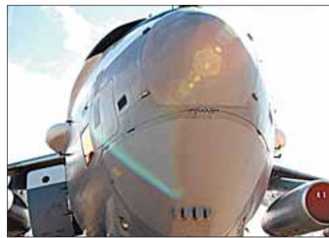
Ещё не все улетели...