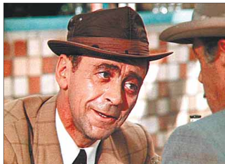
«Крах инженера Гарина». 1973 г.