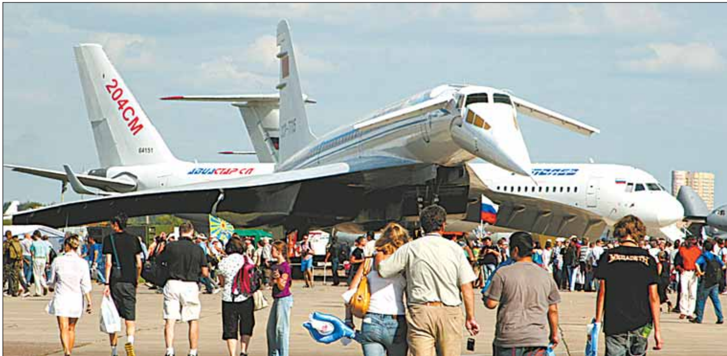
ТУ-144 - первый и последний наш сверхзвуковой лайнер